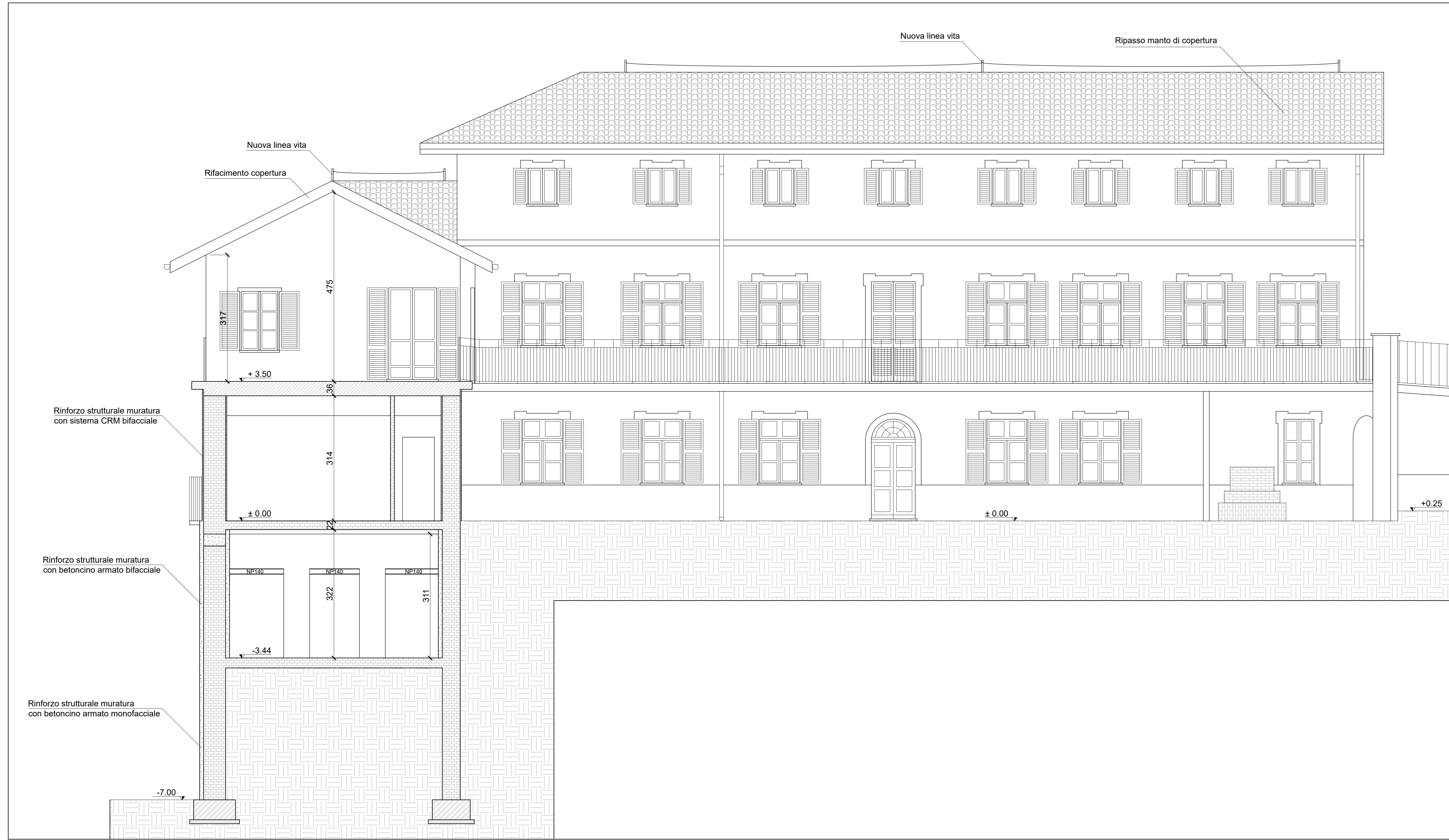
SEZIONE A-A Scala 1:50